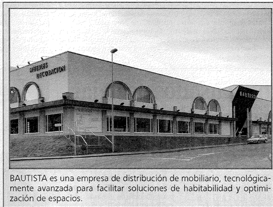
BAUTISTA es una empresa de distribución de mobiliario, tecnológicamente avanzada para facilitar soluciones de habitabilidad y optimización de espacios.

Continuas colaboraciones con empresas del sector e incluso con promotoras, constructoras, inmobiliarias, fabricantes de muebles,...etc. Creación de una línea Contract para la apertura de nuevos mercados.